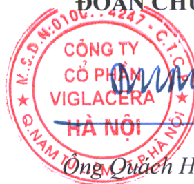
Ông Quách Hữu Thuận